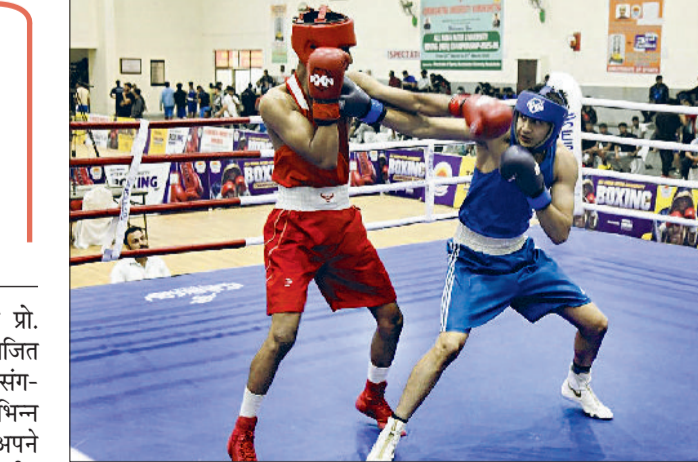
कुरुक्षेत्र। प्रतियोगिता में भाग लेते प्रतिभागी।