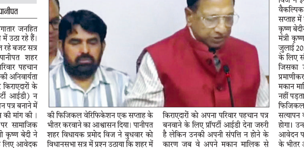
किराएदारों को अपना परिवार पहचान पत्र बनवाने के लिए प्रॉपर्टी आईडी देना जरूरी है लेकिन उनकी अपनी संपत्ति न होने के कारण जब वे अपने मकान मालिक से

पानीपत शहर विधायक लगातार जनहित से जुड़े मुद्दों को विधानसभा में उठा रहे हैं। हरियाणा विधानसभा के चल रहे बजट सत्र के दौरान बुधवार को पानीपत शहर विधायक प्रमोद विज ने परिवार पहचान पत्र के लिए संपत्ति पहचान की अनिवार्यता को लेकर प्रश्न उठाया और किराएदारों के पास संपत्ति पहचान (प्रॉपर्टी आईडी) न होने के कारण परिवार पहचान पत्र बनाने में आ रही समस्या के समाधान की मांग की। विधायक विज के प्रश्न पर सामाजिक न्याय एवं अधिकारिता मंत्री कृष्ण बेदी ने इस समस्या के समाधान के लिए आवेदक किराएदारों को अपना परिवार पहचान पत्र बनवाने के लिए प्रॉपर्टी आईडी देना जरूरी है लेकिन उनकी अपनी संपत्ति न होने के कारण जब वे अपने मकान मालिक से