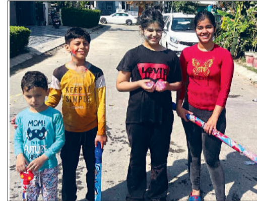
पानीपत। होली खेलते हुए बच्चा पार्टी