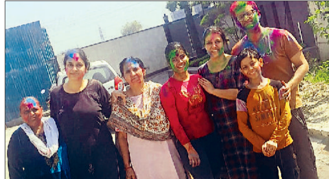
पानीपत। होली खेलते हुए बच्चा पार्टी