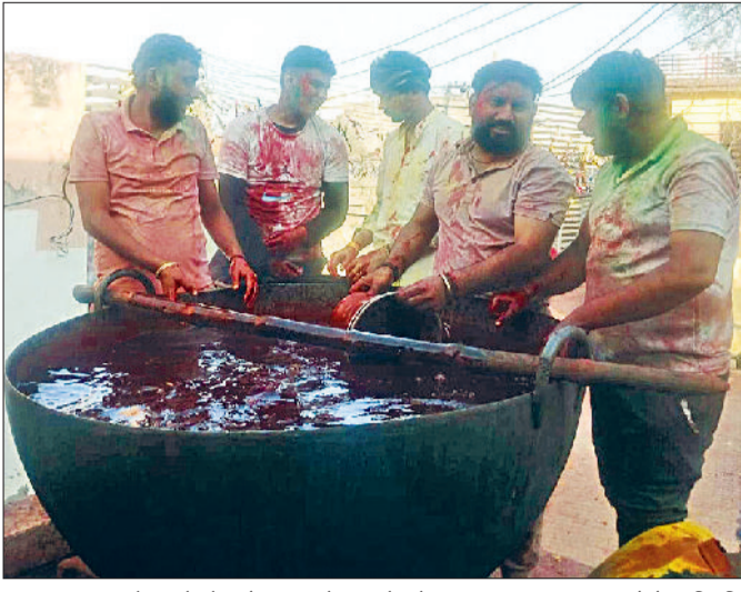
इसराना। गांव नौलथा में चोपालों पर रंग के कढ़ाहे भरे हुए।

रंगों का त्योहार होली फाग पर जम के रंग बरसे। प्राचीन परम्पराओं को आगे बढ़ाने के लिए युवाओं में अलग ही नजारा देखने को मिला। गांव नौलथा, डाहर, बांध, अहर, कुराना, बुआना लाखू, मांडी, पलडी, इसराना के साथ-साथ अन्य गांवों में जम कर रंग गुलाल उड़े। युवाओं से लेकर बुजुर्ग, महिलाओं, बच्चों ने जम कर होली फाग खेला। महिलाओं ने जमकर कोरडे का इस्तेमाल किया। गांव नौलथा का फाग जो क्षेत्र में ऐतिहासिक फाग जाना जाता है वहां पर गांव में झांकियां निकाली गईं और उसके बाद रंगों की डाट होली फाग खेले गईं। गांव की 9 चौक चौराहों पर चोपालों पर रंग बरसाया गया।