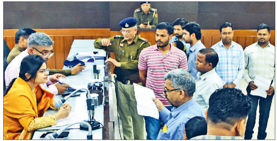
पानीपत। जनता की समस्याएं सुनते अधिकारी।